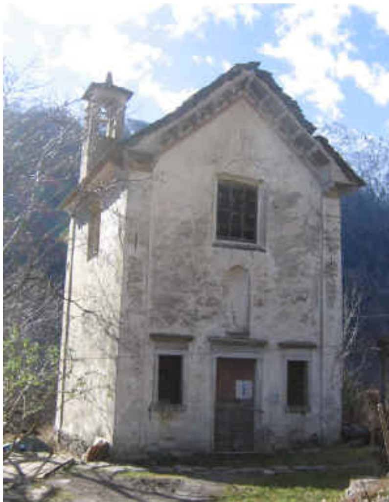
Oratorio di Cheggio, costruito nel 1749, dedicato alla Beata Vergine assunta, che si