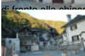
il vecchio forno :