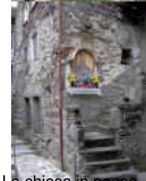
La chiesa in paese