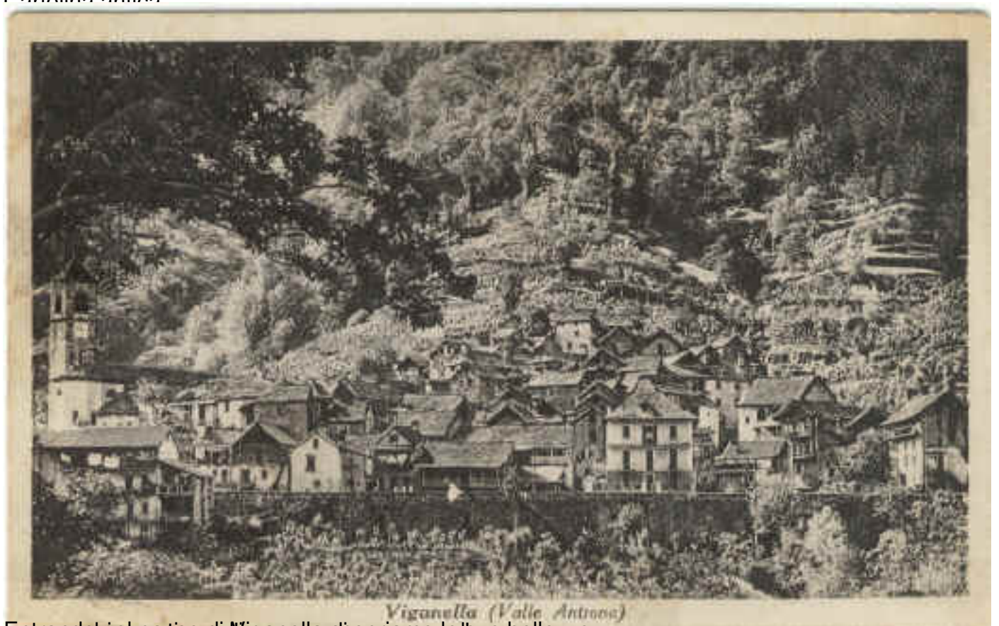
Viganella (Valle Anthona)

Entrando nel paese di Viganella si può apprezzare la bellezza :