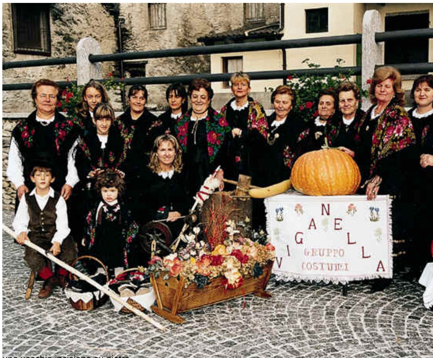
una vecchia incisione su pietra