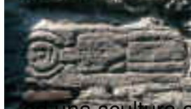
ed una scultura antica