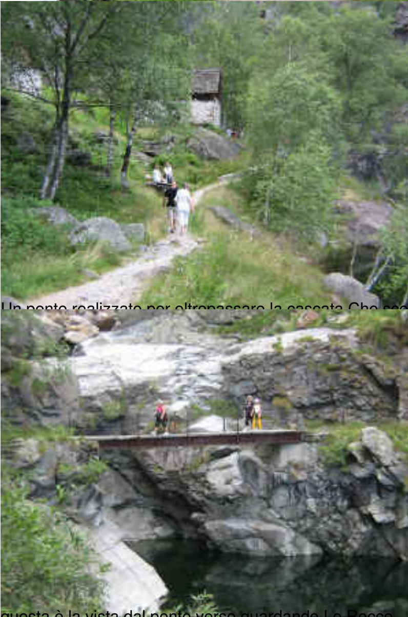
Un ponte realizzato per oltrepassare la cascata. Che scende Attraverso Le Rocce