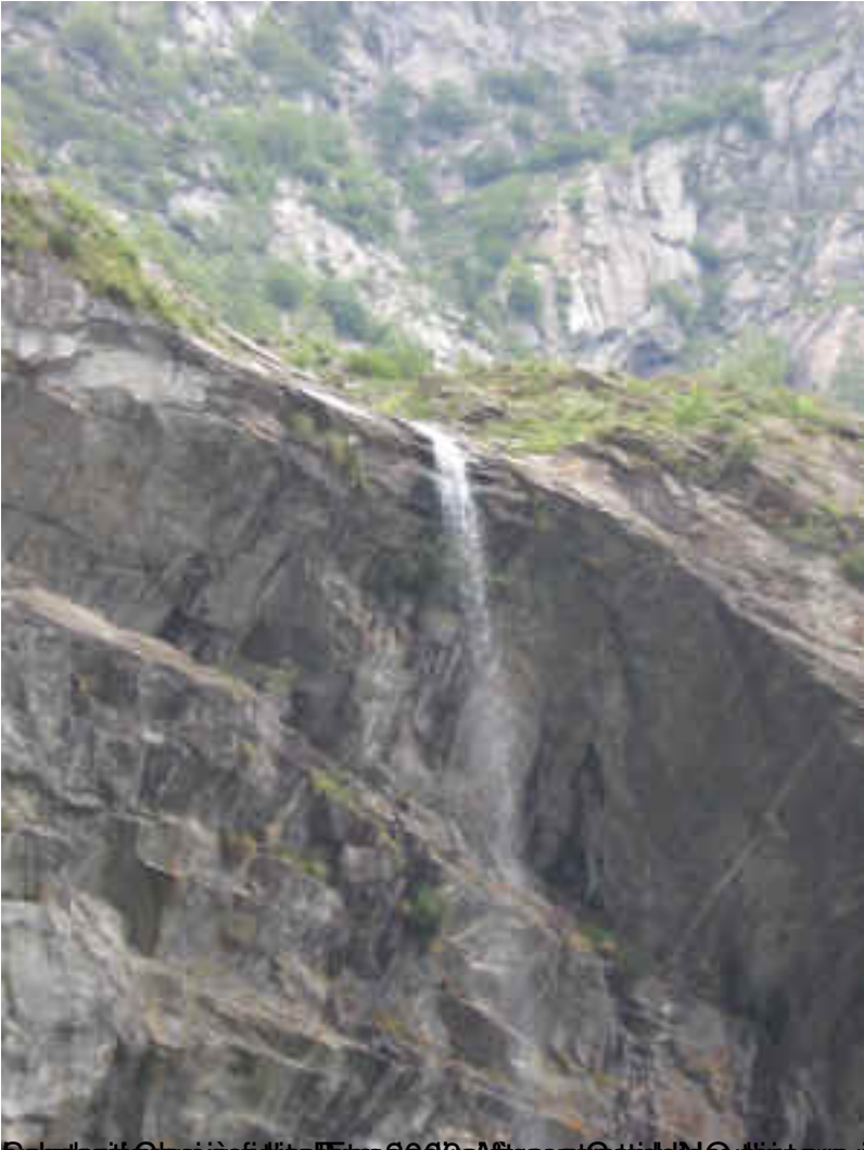
Sopra il lago si è formata l'acqua del torrente che si versa nel lago. È un sentiero molto pericoloso da percorrere.