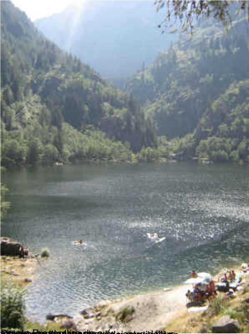
5. Lago di Antrona, lago di acqua dolce, lago di alta quota