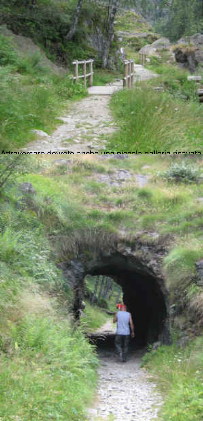
Attraversare dovrete anche una piccola galleria ricavata Nella Roccia